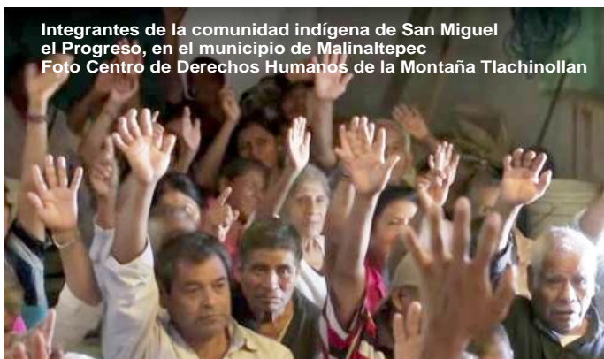
Integrantes de la comunidad indígena de San Miguel del Progreso, en el municipio de Malinaltepec

La comunidad me'phaa (tlapaneca) de San Miguel el Progreso, o Juba Wajjin, en el municipio guerrerense de Malinaltepec, triunfó literalmente sobre el proyecto minero Corazón de Tinieblas mediante una fallo legal de trascendencia nacional. Al sentenciar en favor del amparo y la protección judicial demandada por dicha comunidad contra la explotación minera, en ese territorio de la Montaña de Guerrero, la jueza primera de distrito Estela Platero Salgado dio por esencialmente fundados los conceptos de violación de sus derechos, y que se demostró el incumplimiento de la obligación constitucional y convencional del Estado mexicano de respetar los derechos de esta comunidad indígena-agraria.