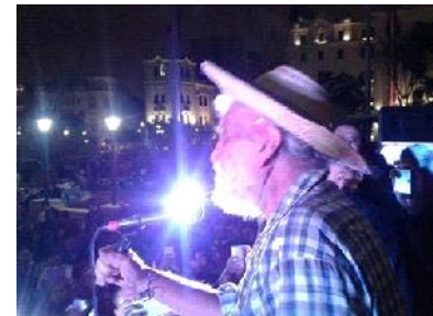
Discurso durante mitin en Marcha contra indulto a Fujimori en Lima