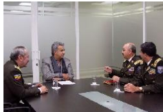
Lenin Moreno con los altos mandos militares, ¿Rutina protocolar o precaución?

Finalmente, está el momento del choque. No han pasado ni tres meses de gestión y la profunda ruptura - surgida desde adentro- ha colocado al gobierno de Lenin Moreno ante una indefectible línea de acción al futuro: no tiene otra opción que seguir mirando hacia adelante.