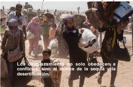
Los desplazamientos no solo obedecen a conflictos, sino al avance de la sequía y la desertificación.

Ahora se teme que el avance de la sequía y de los