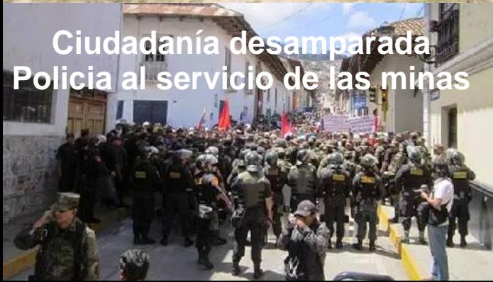
Ciudadanía desamparada Policia al servicio de las minas