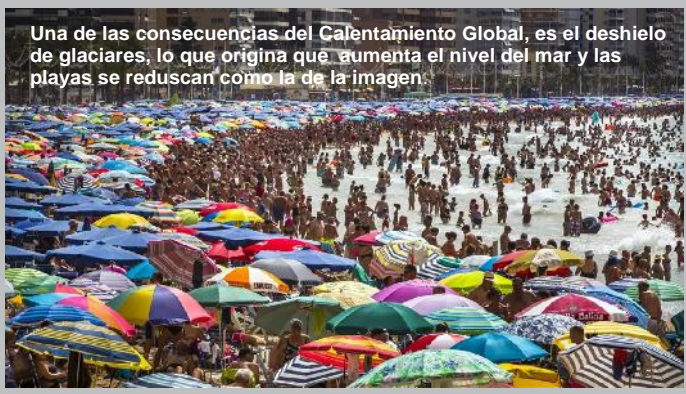
Una de las consecuencias del Calentamiento Global, es el deshielo de glaciares, lo que origina que aumente el nivel del mar y las playas se reduzcan como la de la imagen.