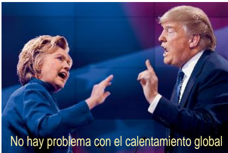
No hay problema con el calentamiento global

McKibben sostuvo en el noticiero de "Democracy Now!": "Si uno considera la forma en que Estados Unidos se movilizó durante la Segunda Guerra Mundial, el poder industrial que desarrollamos, y luego hacemos los cálculos, está lejos de nuestras posibilidades que en el breve tiempo del que disponemos podamos construir suficientes paneles solares y turbinas de viento. Pero se va a necesitar el mismo tipo de concentración de esfuerzos". Tras el debate vicepresidencial del martes, May Boeve, directora ejecutiva de 350.org, expresó: "Una vez más, el moderador del debate de esta noche falló en lo que respecta al cambio climático. El silencio es otra forma de negación y las cadenas de televisión están perjudicando a la población al ignorar el