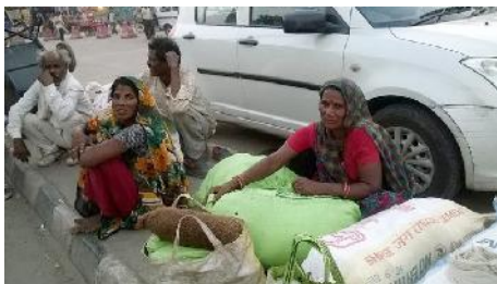
Todos los años llegan migrantes a las estaciones de tren de Nueva Delhi, procedentes de distintas regiones de India, escapando de las inundaciones y la sequía.