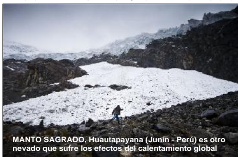
MANTO SAGRADO. Huautapayana (Junín - Perú) es otro nevado que sufre los efectos del calentamiento global

A través de imágenes satelitales, los especialistas de la ANA ubicaron su reducida superficie de menos de un kilómetro cuadrado (0.72 km 2 ). "Se sabe que es mucho más pequeña que el nevado Pastoruri y que es la más próxima a desaparecer", detalla Santillán.