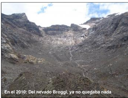
En el 2010: Del nevado Broggi, ya no quedaba nada