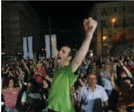
Manifestación por el "no" en Syntagma en la víspera del referéndum del 5 de julio

Publicamos un trozo del artículo del compañero Theodoros Karyotis sobre la alternativa que ahora tiene el pueblo griego.