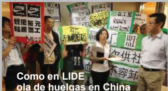
Como en LIDE ola de huelgas en China

años de cotizaciones a la seguridad social que la empresa no había pagado y una indemnización por las vacaciones anuales y las bajas de maternidad que anteriormente no habían disfrutado, además de un plus de calefacción y una indemnización por despido para quienes hayan optado por no trasladarse a la nueva ubicación.