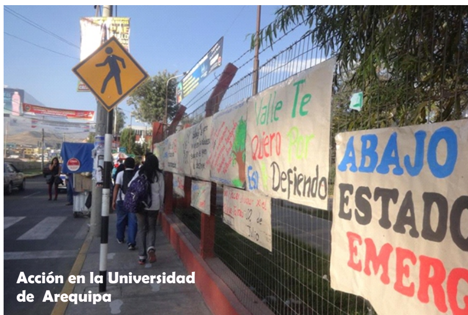
Acción en la Universidad de Arequipa