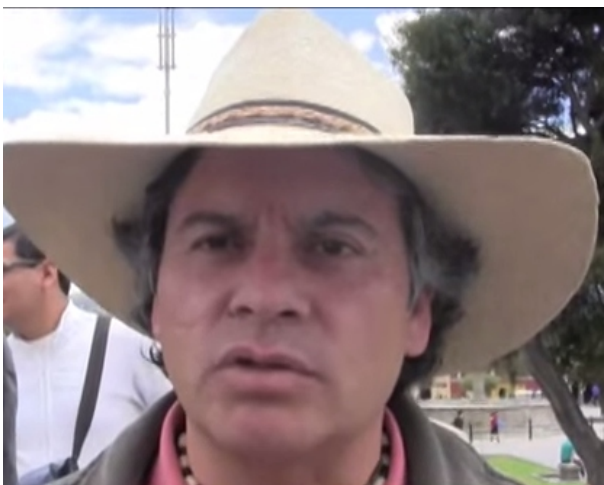
Detienen a Expositor Ambientalista

Represalias contra los que luchan El SUR del Perú Tomado por las FF.AA.