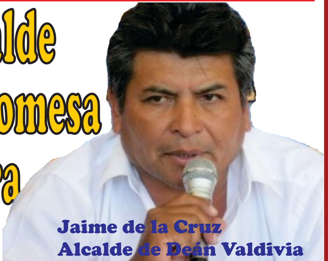
Jaime de la Cruz Alcalde de Deán Valdivia