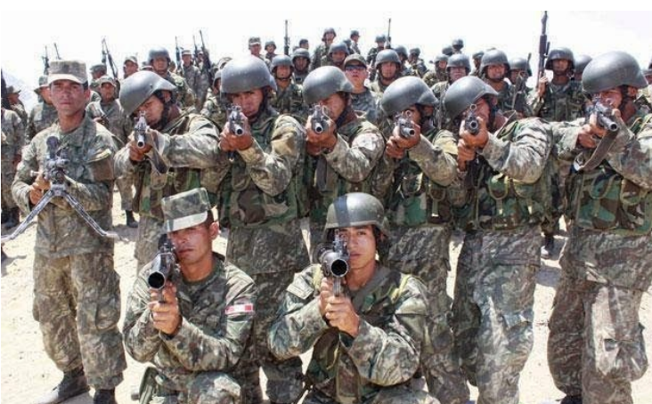
Ya están en Islay

Southern ha anunciado que ampliaría el tiempo de suspensión de sus actividades hasta que se calmen las cosas, esperando convencer a la población con regalitos y esperando que con las masivas detenciones ya no haya ánimos de protesta. El gobierno utilizó una “cortina de humo” los días del paro macro regional, cuando fue capturado en Bolivia un corrupto colaborador de Humala. Las organizaciones populares vienen coordinando un paro nacional en rechazo al proyecto Tía María.